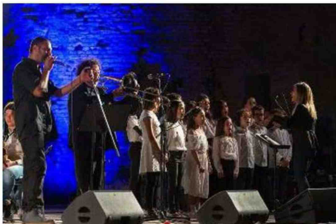
Una foto dell'edizione 2021 di 'Pazzi di jazz'